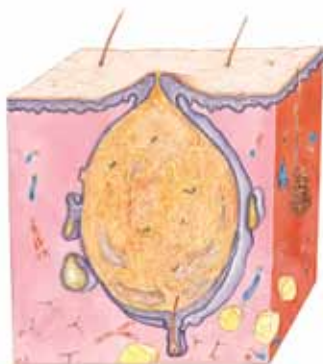
STENGT / HVIT HUDORM

Bildene under viser to typer hudormer, en åpen og en stengt. På neste side viser bildene hvordan hudormen først har utviklet seg til en kvise, så til en byll. Det er ikke alle hudormer som utvikler seg til kviser, men så lenge det produseres ekstra mye talg og hudceller, er det større fare for at det dannes nye hudormer og kviser. De fleste kviser forsvinner av seg selv, men de som blir harde og går i dybden, kan føre til varige arr.