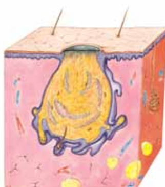
ÅPEN / SVART HUDORM

Synes nesten ikke, men kan kjøennes som små nupper på huden.